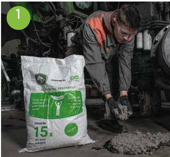
1 Ausgelaufene Flüssigkeit mit Absorptionsmittel abdecken