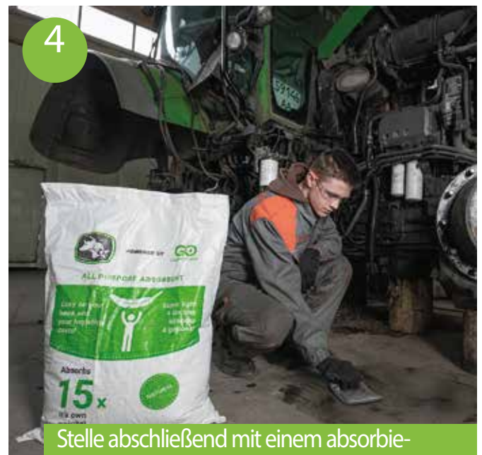
4 Stelle abschließend mit einem absorbierenden Kissen von Green Ocean behandeln