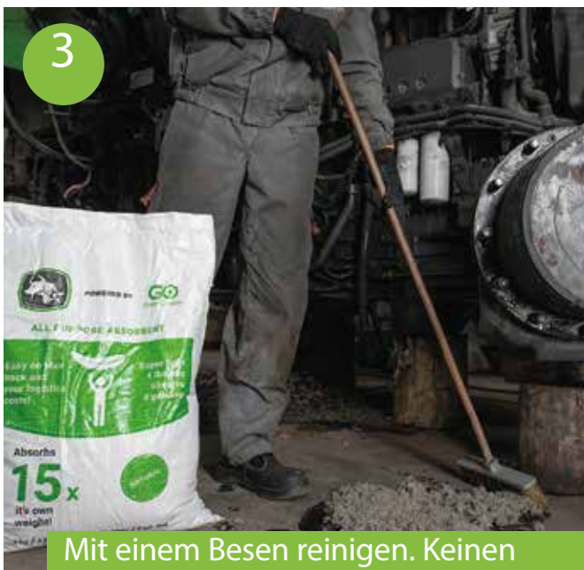
3 Mit einem Besen reinigen. Keinen Besen mit Metallborsten verwenden