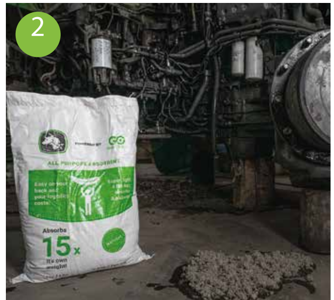
2 Einige Sekunden warten, bis die Flüssigkeit vollständig aufgenommen ist